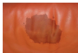
Tache de graisse incrustée