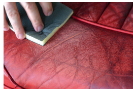
Ponçages des irrégularités