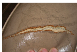
Cuir vieux, longue déchirure